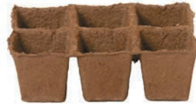
SIX CELLULES 3"

Volume : 8 400 ml – 512 po 3 Hauteur : 178 mm – 7" Largeur du haut : 293 mm – 11 1/2" Largeur du bas : 203 mm – 8"